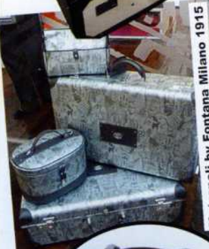
Metropoli by Fontana Milano 1915

Globetrotter. Che sia per vacanza o per motivi di lavoro, poco importa. Partire diventa un'altra occasione per fare sfoggio del proprio stile. Gli accessori da viaggio guardano al passato: ecco allora riapparire i set coordinati come quelli delle star di un tempo, paparazzate all'aeroporto. Dal beauty-case al maxiborsone, passando per l'inseparabile bag ladylike, tutto è all'insegna dell'eleganza, del lusso raffinato e del pattern preferito, da completare con l'ombrello fantasia. I portadocumenti e le valigie si fanno preziosi nei materiali, trasformandosi in segni di distinzione. Le stampe omaggiano i monumenti antichi. Per chi ama l'avventura, torna lo zaino in versione multitasking o il trolley camouflage. E a fare da portafortuna per le mete più imprevedibili, i bagagli con simboli scaramantici.